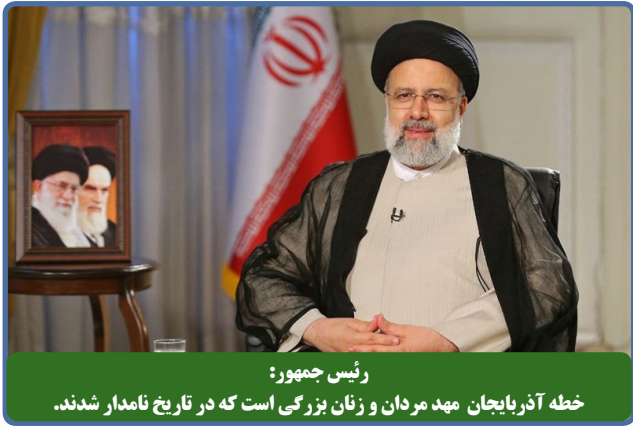
رئیس جمهور: خطه آذربایجان مهد مردان و زنان یزگی است که در تاریخ نامدار شدند.